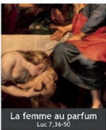
La femme au parfum Luc 7,36-50

Mais on le sait, des femmes ont suivi Jésus pour l'aider dans son ministère et sont allées plus loin que les hommes choisis par Jésus, puisqu'elles étaient présentes au pied de la croix. Ce sont même elles qui, les premières, ont remarqué l'absence de Jésus au tombeau. C'est ainsi que l'on retrouve Marie de Magdala, Marie mère de Jacques le mineur et de Joses, et Salomé (Marc : Ch.15, V. 40 à 41. et Ch. 16 V. 1 à 8.). Et que pensez de cette païenne cananéenne qui ose répondre à Jésus à propos de miettes de