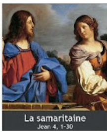
La samaritaine Jean 4, 1-30