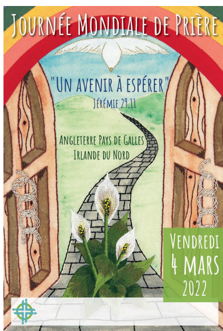
Tapisserie d'Ange FOX

La célébration 2022 est préparée par des femmes de l'Angleterre, Pays de Galles et Irlande du nord. Elle est basée sur la lettre que le prophète Jérémie a écrite aux exilés en Babylonie. Les exilés se trouvaient dans un contexte de souffrance, d'incertitude et de points de vue opposés sur la façon de réagir au moment présent. Aujourd'hui, nous nous réunissons pour