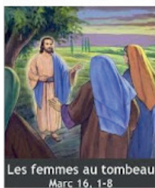
Les femmes au tombeau Marc 16, 1-8