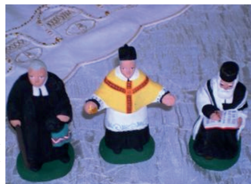
Santons d'une crèche alsacienne