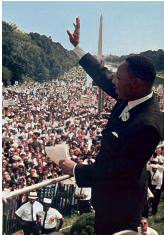
Martin Luther King, lors de son discours, le 28 août 1963.

(1) Cité dans : Serge Molla, Martin Luther King, prophète. Labor et Fides, 2018