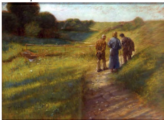
Fritz von Uhde, pastel sur papier, 1891