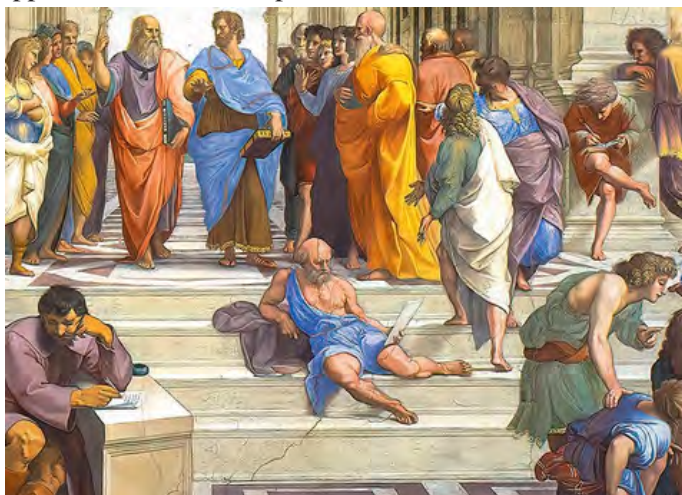
L'école d'Athènes de Raphaël © Musée du Vatican

Socrate : « La sagesse intérieure est un devoir envers les autres. Nous devons manifester notre joie pour que d'autres la ressentent. La tristesse est tellement répandue et tellement de personnes se plaignent de ceci ou de cela. Ceux qui n'ajoutent pas leur mécontentement à cette mauvaise humeur ambiante sont des bienfaiteurs. Ils font cadeau de leur joie et purifient l'air pour que d'autres apprennent à mieux respirer dans leur existence. »