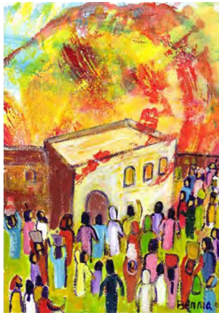
Pentecôte : hymne à la joie du Christ.

Mais est-ce bien raisonnable en regard de tant et tant de difficultés qui ne manquent pas de jaloner toute vie humaine ? N'est-il pas judicieux de se poser la question : Est-il légitime de se réjouir en regard de l'actualité ? Et en miroir, si nous nous éloignons de cette affirmation positive concernant cette joie qui doit nous habiter, nous écartons-nous de Dieu et du message salvateur des Ecritures ?