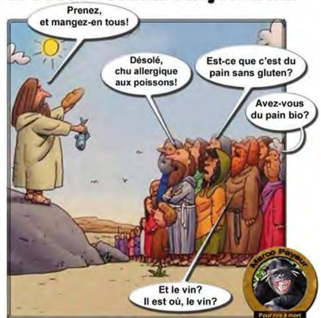
Illustration extraite du blog d'André Nouis,