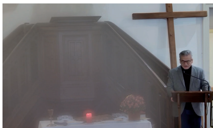
Les cultes enregistrés sont vus par 60 personnes, en moyenne. Pendant le mois d'octobre, certains parmi vous ont peut-être cru que les opérateurs étaient nostalgiques des flous artistiques de David Hamilton (en 1968) ou voulaient insister sur les éclaircissements qu'apporte la prédication. Il s'agissait simplement de la buée sur la lentille. Cela ne se produit plus depuis qu'il y a du chauffage. Acceptez nos excuses !