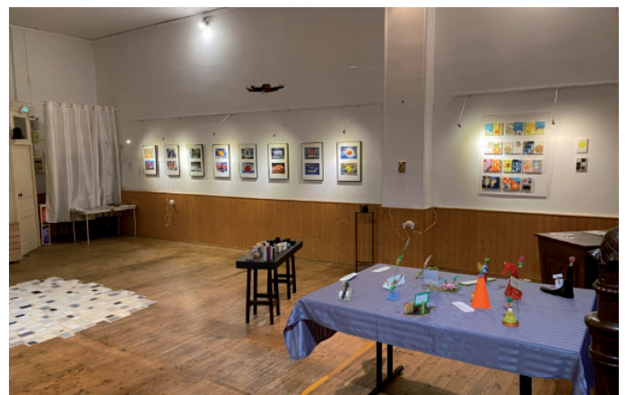
Exposition du collectif "les IMPARFAITS": photos, peintures, sculptures et installations rappelant "l'esprit d'enfance".

Très appréciés : les journaux descendant au milieu du temple sous forme de drone. Les hélices sont des Origami formant des Grues, oiseaux de Paix au Japon. Une bonne nouvelle !