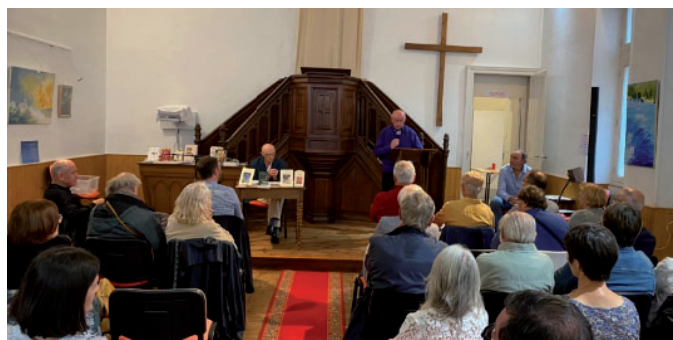
Exposition de photos et peintures lors de la journée du patrimoine?