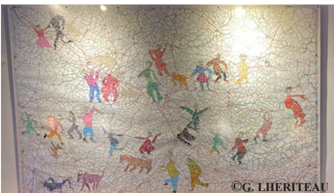
Exposition des œuvres de Gérard Lhériteau organisée par la Cimade au temple du 18 au 23 novembre. La migration est symbolisée par des découpages de cartes routières, en faisant apparaître des silhouettes délimitées par les routes.