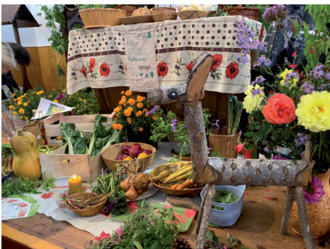
Culte des récoltes le 6 octobre. Animation œcuménique par l'Eglise Verte, suivie d'un repas partagé.