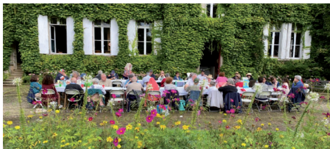
Journée de rentrée le 8 septembre. Repas joyeux entre deux gouttes de pluie chez madame Pilastre.