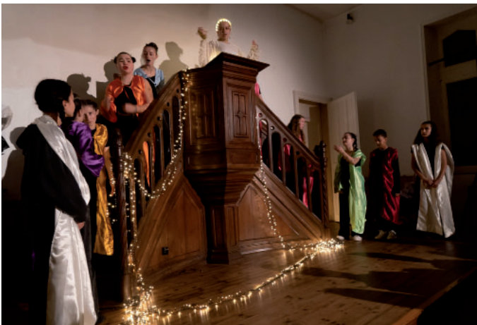
Les organisateurs du festival des Spectaculaires ont remercié publiquement, à de nombreuses reprises, les "Rencontres Culturelles du Temple" pour la mise à disposition des locaux. Il y a eu plusieurs ateliers et quelques représentations. Ci-dessus une troupe d'adolescents de Mouchamps joue la pièce "la Lumière". La Sagesse convoque les 7 péchés capitaux pour qu'ils rendent compte de leurs actions sur les hommes. Voir toutes les photos à l'adresse : https://www.facebook.com/photo?fbid=964879805432022&set=pcb.964882388765097