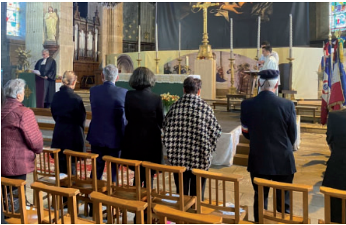
Cérémonie œcuménique le 11 novembre en l'église Saint-Louis de la Roche sur Yon.