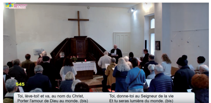
Le dimanche 24 novembre, le temple était plein pour le culte d'accueil "officiel" du pasteur par le président de la région. Voir sa prédication pages 5 et 6